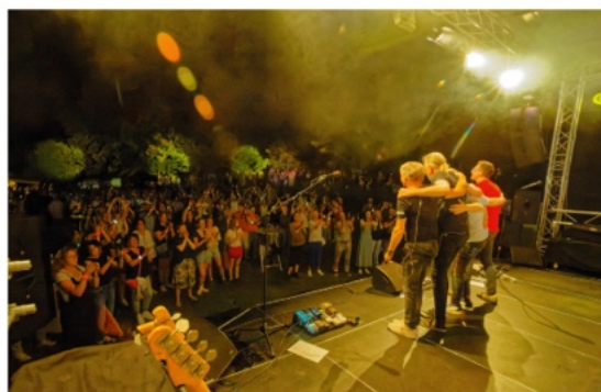
14. Juni 2025 A Tribubute to Golfplay Glowing in the Dark