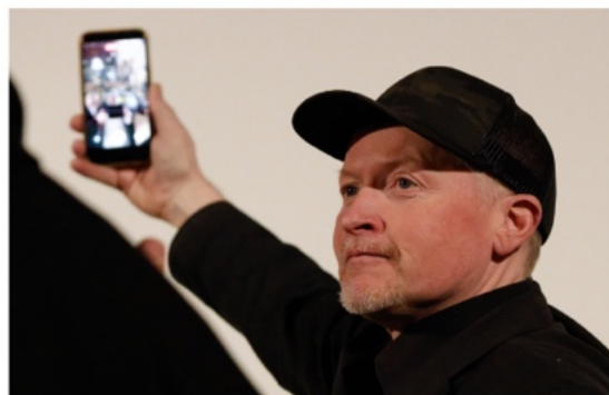
26. Oktober 2025 Joey Kelly No Limits am grünen Band und in Panamericana