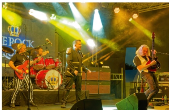
13. Juni 2025 We Rock Queen Best of Queen - The Show Goes on!