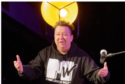
18. März 2025 Sebastian Krumbiegel "Aufstehen - Weitermachen"