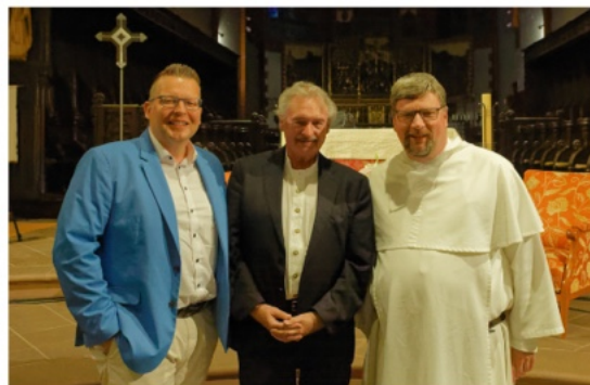
25. Mai 2025 Jean Asselborn "Quo vadis Europa"