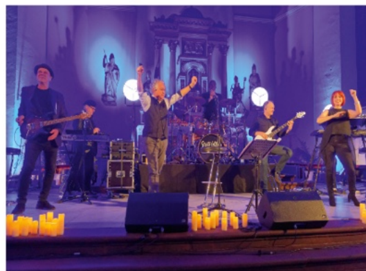
11. Oktober 2025 Still Collins Ballads & Lovesongs in der Kirche St. Georg (Sehlem)