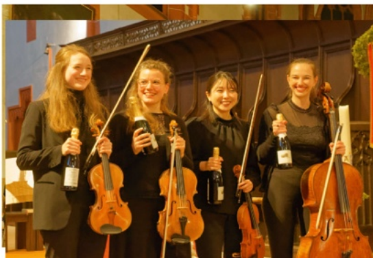
17. Mai 2025 SWR Regio Tour Streichquartett "Deutsche Radio Philharmonie"